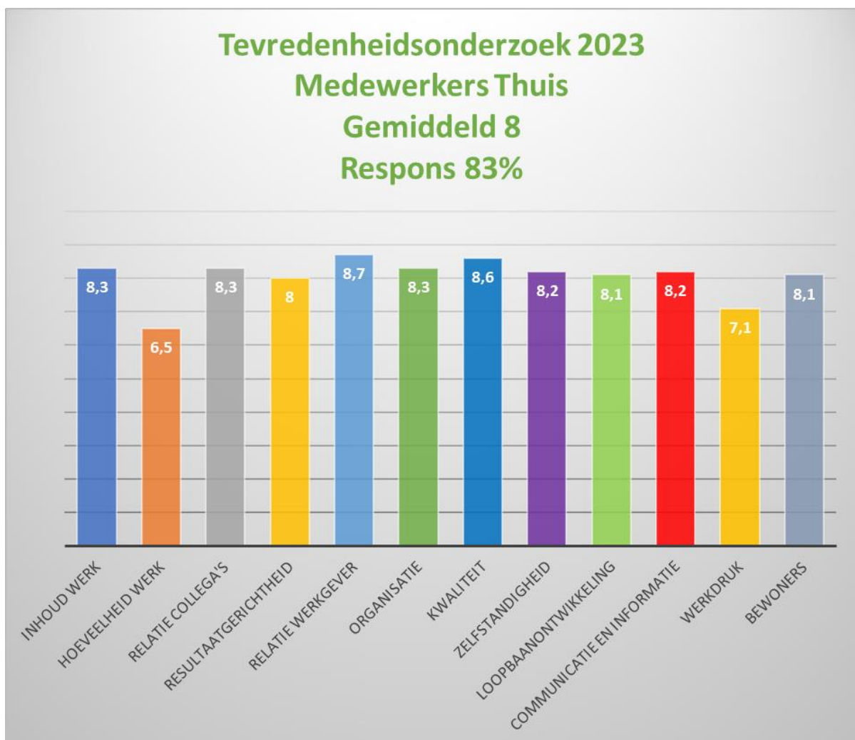
Tevredenheidsonderzoek Medewerkers 2023

Tweejaarlijks worden medewerkers gevraagd mee te werken aan een tevredenheidsonderzoek. De uitkomsten van dit onderzoek worden gebruikt om te werken aan een continue verbetering van de kwaliteit van zorg- en dienstverlening en voor verplichte metingen die van Thuis Lemelerveld als zorgaanbieder geëist wordt. Wij vragen onze medewerkers o.a. naar hun ervaring over de organisatie, over het werk en werkdruk, en de zorg/ begeleiding die wij aan de bewoners leveren. Daarbij gaat het over onderwerpen en kwaliteitsaspecten voor verantwoorde zorg. De vragen worden gesteld aan de hand van stellingen waaraan een cijfers verbonden is. Daarnaast wordt gevraagd via open vragen aan te geven waar men verbeterpunten ziet om de eigen tevredenheid en die van de bewoners/ deelnemers te vergroten. Het onderzoek wordt anoniem verwerkt.